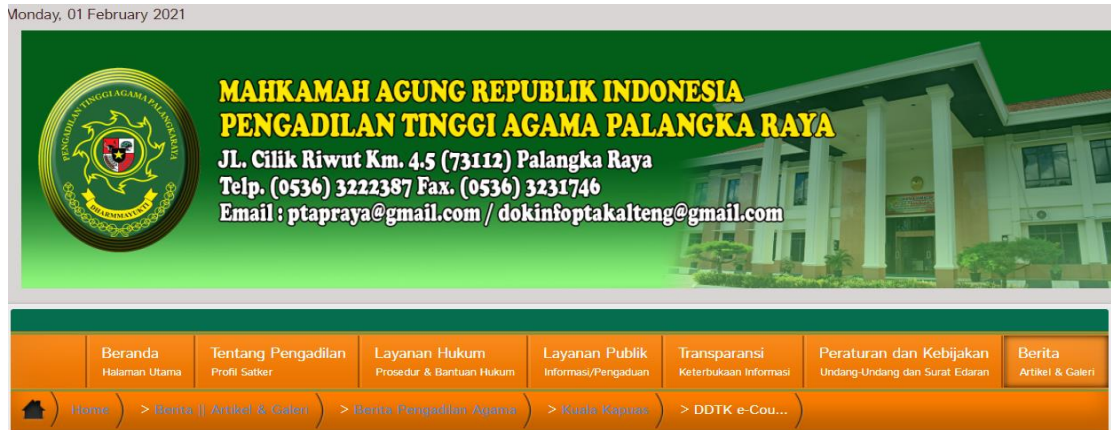
Gambar 1.1 Halaman Website Pengadilan Tinggi Agama Palangka Raya