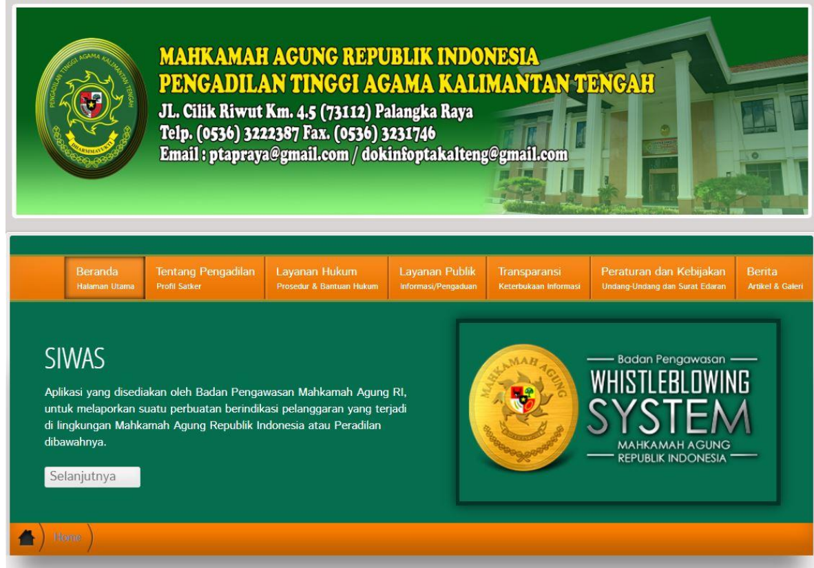
Gambar 1.1 Halaman Website Pengadilan Tinggi Agama Palangka Raya